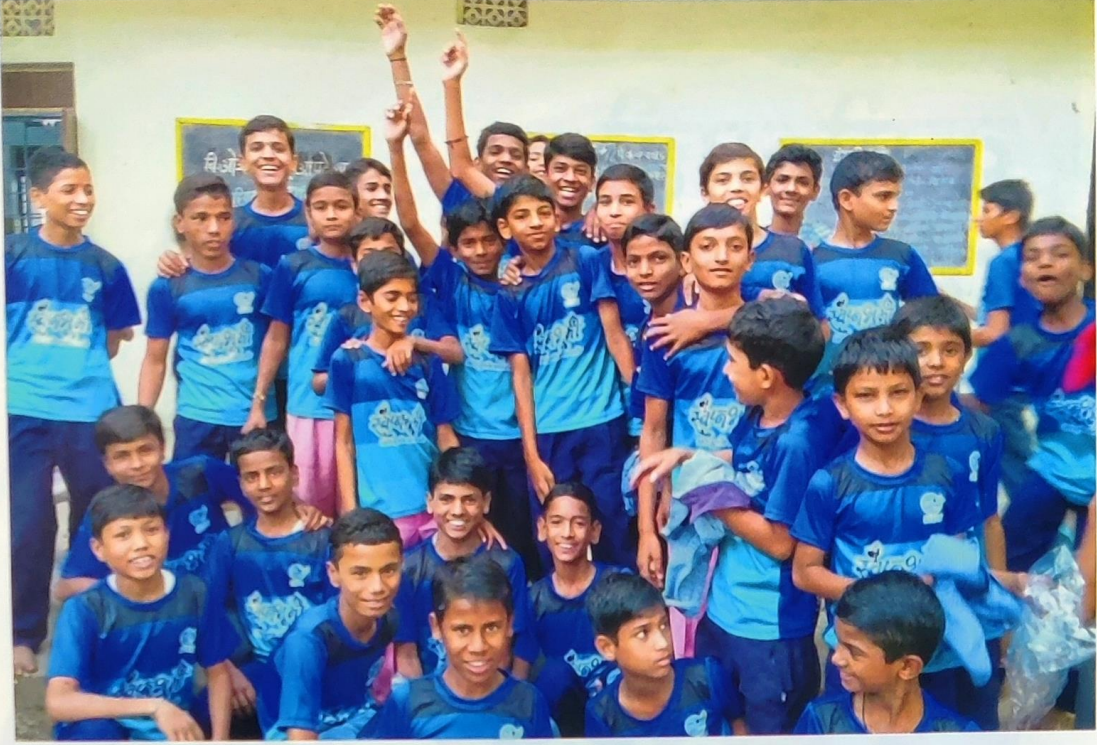
स्वप्नभूमीत शिक्षण घेणारी बच्चे कंपनी.