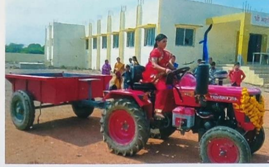
बचत गटाची महिला सदस्या ट्रॅक्टर चालविताना.